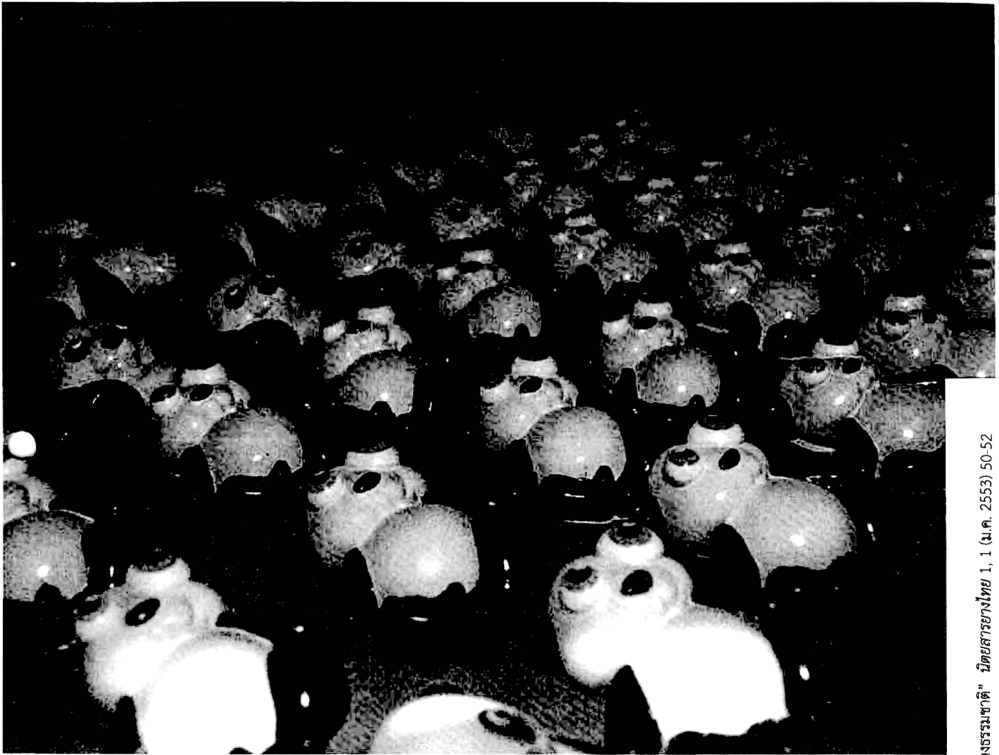
“ตุ๊กตาจากยางธรรมชาติ” นิตยสารยางไทย 1, 1 (ม.ค. 2553) 50-52